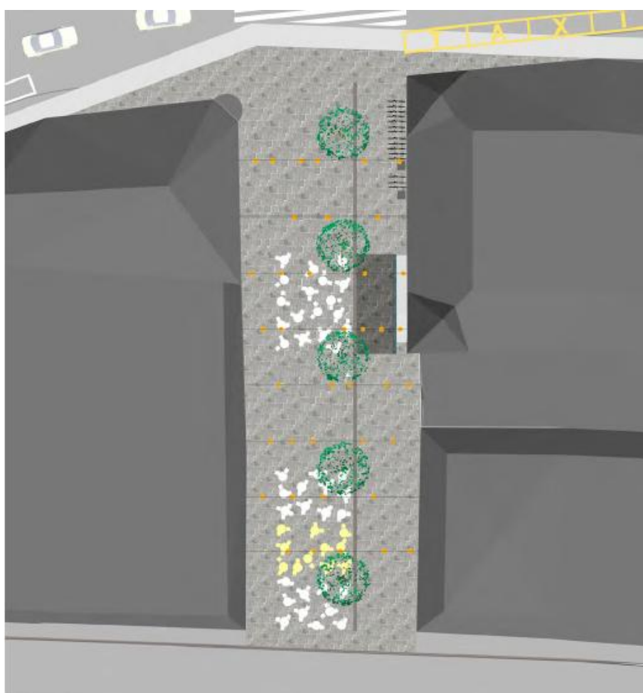
Plans proposés pour l'aménagement de la Place de l'Ancienne-Poste, vue intérieur et vue aérienne