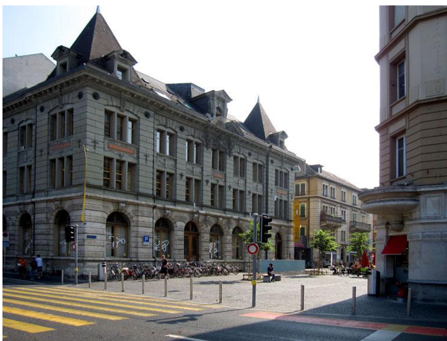
Vue depuis la rue des Remparts sur la bibliothèque, le parc à vélo et la fontaine.

Plusieurs mesures ont été mises en place pour transformer cette "rue" en une véritable "place" homogène et conviviale. Des terrasses à café, des bancs publics et un éclairage particulier ont notamment été installés de manière à ce que les piétons s'y sentent le plus à l'aise possible. Cet espace urbain est devenu, grâce à cela, à la fois un des axes principaux reliant la gare au centre historique de la ville mais aussi une vraie place publique particulièrement confortable en période estivale.