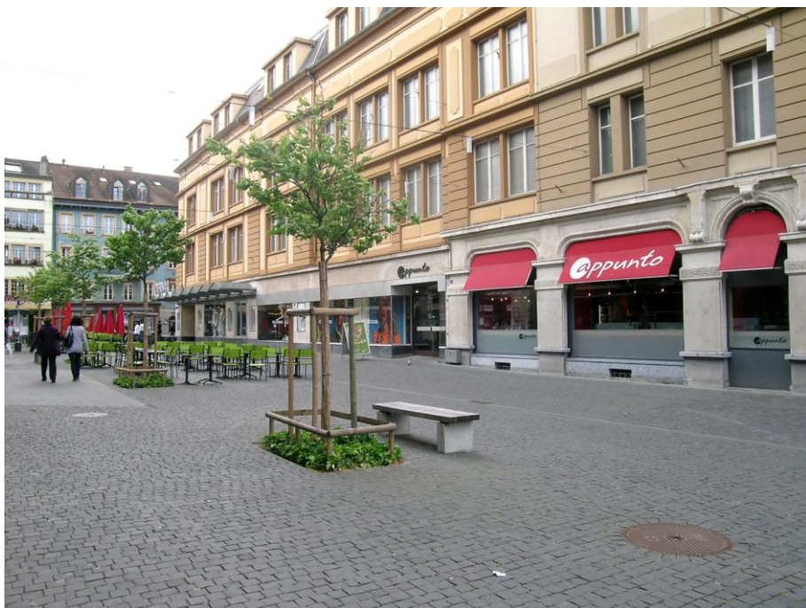
Vue de la Place de l'Ancienne-Poste: terrasses à café, arbres de Judée, bancs, éclairage et pavés.