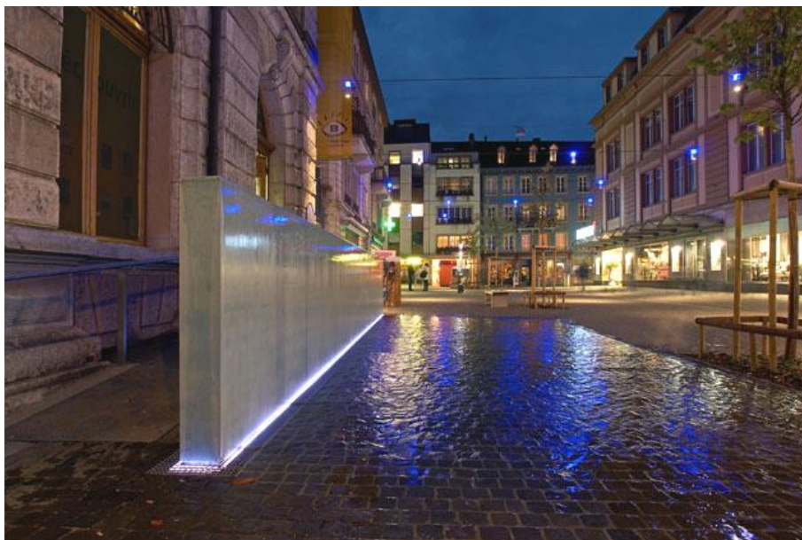
Vue de la place de l'Ancienne-Poste de nuit avec éclairage et fontaine