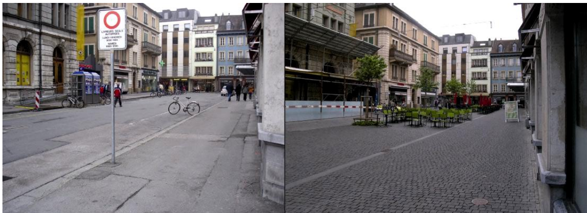
Vue de la Place de l'Ancienne-Poste avant les transformations (gauche) après les transformations (droite) (Source: THIBAUD-ZINGG SA ARCHITECTES URBANISTES & Service de la mobilité)