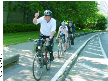
J.-P. Di Silvestro

Adolf Ogi, le parrain de l'action « A vélo au boulot » pédale jusqu'au palais des Nations. L'ONU a participé à l'édition 2007.