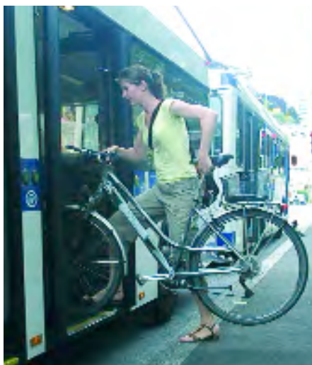
Embarquement des vélos dans les TL

Monter sur les hauts de Lausanne en bus et redescendre à vélo, c'est désormais possible, notamment grâce à la pétition de PRO VELO qui a recueilli près de 2'000 signatures. Suite à l'expérience pilote réalisée à bord des Métrobus – qui remplacent la «Ficelle» Ouchy-Gare-Flon dans laquelle les vélos étaient admis – les Transports publics lausannois (TL) ont décidé d'accepter les cyclistes et leur monture dans tous les bus, dès l'été 2007, sauf dans les véhicules de petite capacité. Moyennant un billet de plus, les vélos sont autorisés, si la place le permet, aux endroits prévus à cet effet (marqués par un pictogramme visible dès l'entrée), en dehors des heures de pointe. Les cycles pliés ou emballés dans une housse ainsi que les petits vélos d'enfants se transportent par ailleurs gratuitement.