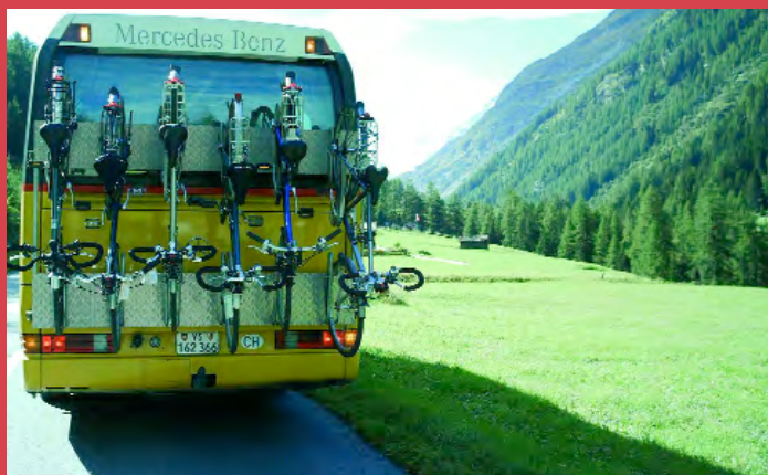
Porte-vélos sur car postal

Léman) autorisent les vélos sur certaines lignes seulement. Les bus urbains de Bienne et tout récemment de Lausanne (voir ci-contre) acceptent de transporter les vélos, tandis que Genève les accueille uniquement sur les lignes de campagne le week-end.