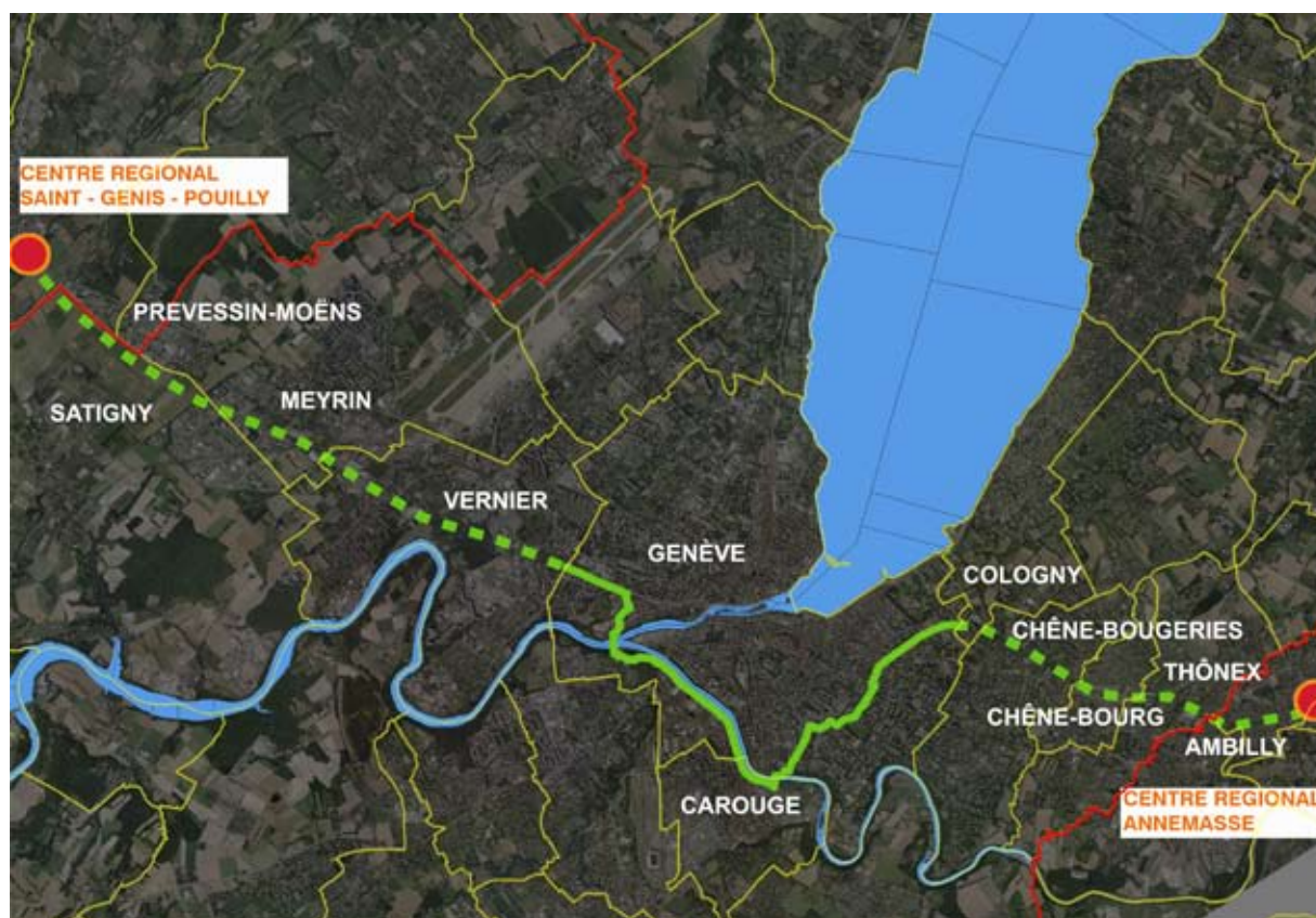
Fig. 1 : Schéma de la Voie Verte d'agglomération (tracé en vert, indicatif hors Ville de Genève), les frontières communales (tracé en jaune), les frontières cantonales (tracé en rouge)

La Voie Verte d'agglomération consolide un itinéraire de mobilité douce partiellement existant avec le souci d'unité, de lisibilité, de continuité et de sécurité sur une longueur de 22km environ. Il constitue un espace public majeur et permet l'articulation entre échelle de l'agglomération, l'échelle de la ville et l'échelle des quartiers.