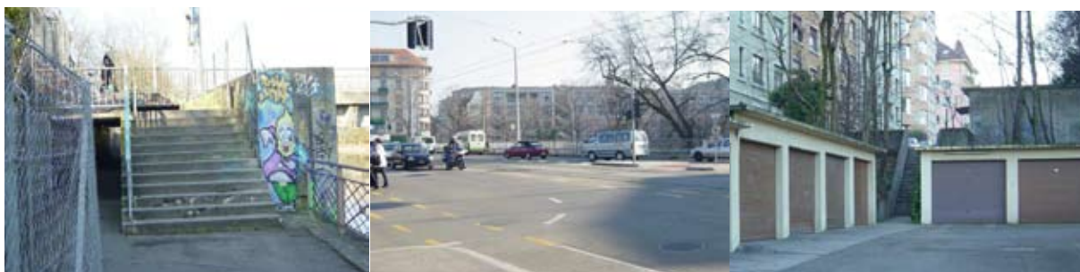
Fig. 3 : Illustrations de quelques obstacles relevés, Passage sous le pont de Saint-Georges, Carrefour du Pont des Acacias, Vers le Chemin des vergers