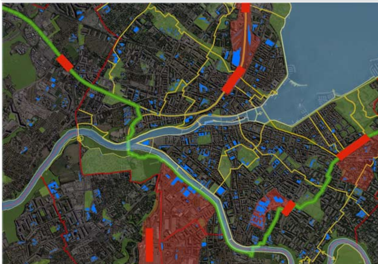
Fig. 5 : Carte illustrant la Voie Verte d'agglomération, avec les promenades du plan piéton (Jaune), les espaces verts (Vert) et les secteurs qui font l'objet de projet de requalification (Rouge)