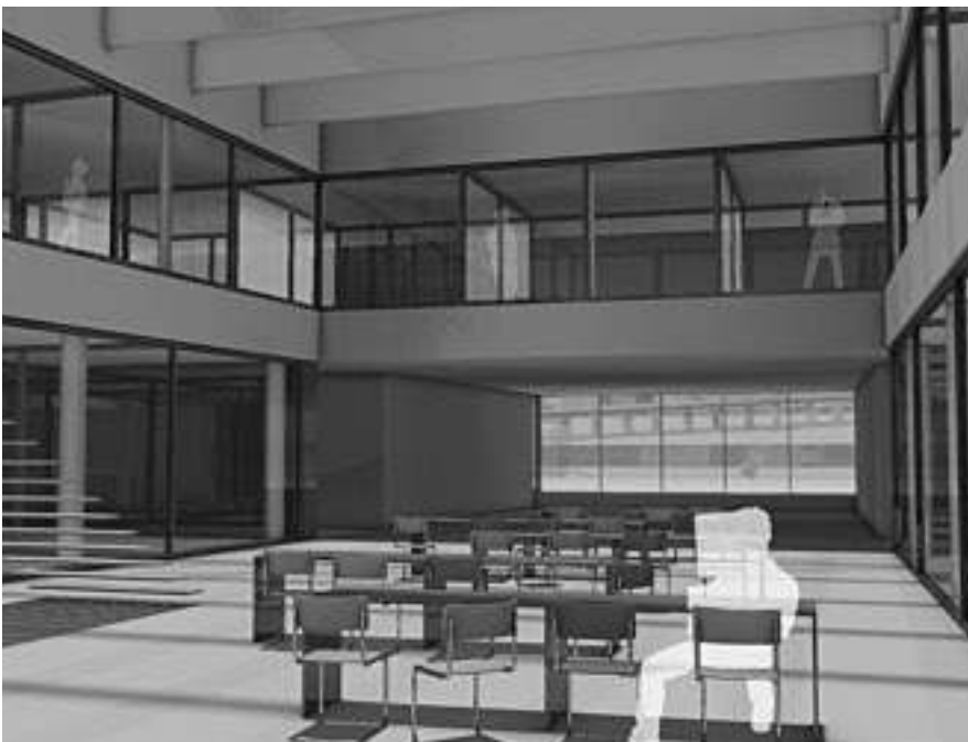
Für den Neubau der FHNW in Olten wurden projektbezogene Genderkriterien ins Pflichtenheft der Architekten aufgenommen.

Bezüglich der inneren Organisation wurden für die sozialen Bedürfnisse eines störungsfreien Miteinanders beziehungsweise unterschiedlicher und wechselnder Bedürfnislagen die folgenden funktionalen Erfordernisse sowie ihre baulich-räumliche Umsetzung untersucht: Die Trennung einzelner Funktionsbereiche erfordert nach NutzerInnen getrennte Rückzugsräume, die Flexibilität in der Nutzung ist mittels Grundrissstruktur und mittels Schaltbarkeit der Zimmer umsetzbar; die