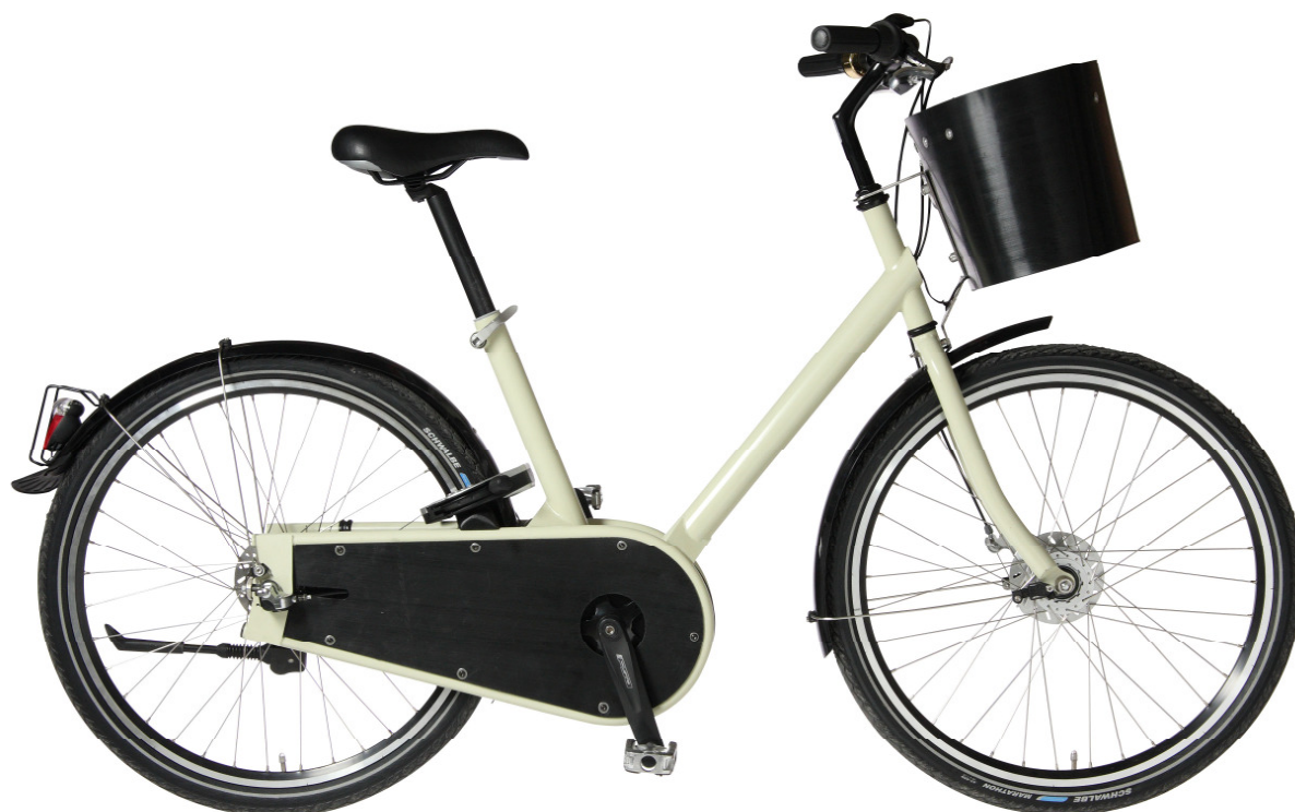
Illustration 2: type de vélo utilisé: Paper Bicycle de Simpel Sàrl