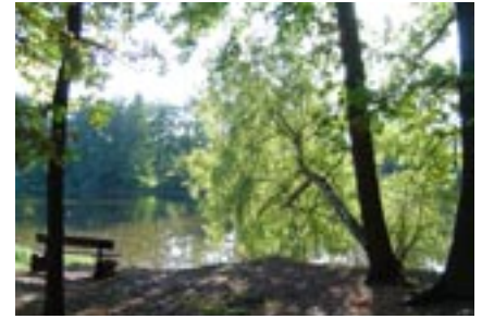
Das Wanderwegenetz führt durch attraktive und abwechslungsreiche Brandenburger Landschaften.

des hier vorgestellten Modells ist ein ganz wesentlicher Aspekt. Alle vier Weitwanderwege müssen erhalten und verbessert werden. Darüber hinaus soll durch das Projekt erreicht werden, dass auch Wanderangebote außerhalb der Regionen am Weitwanderwegenetz eingebunden werden.