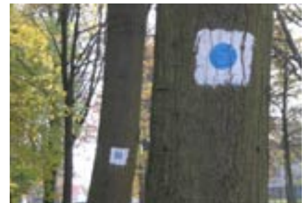
Wegemarkierung: Der lichtblaue Punkt kennzeichnet den 66-Seenweg.

im Rahmen dieses Projektes erfolgte durch FUSS e.V. und den Förderverein „66-Seen-Wanderweg“ e.V. in erster Linie im Hinblick auf die gute Erreichbarkeit mit öffentlichen Verkehrsmitteln. Das Weitwanderwegenetz wurde in acht Bereiche mit insgesamt derzeit 78 Wanderwege-Etappen aufgeteilt. Durch die eigene Entscheidung