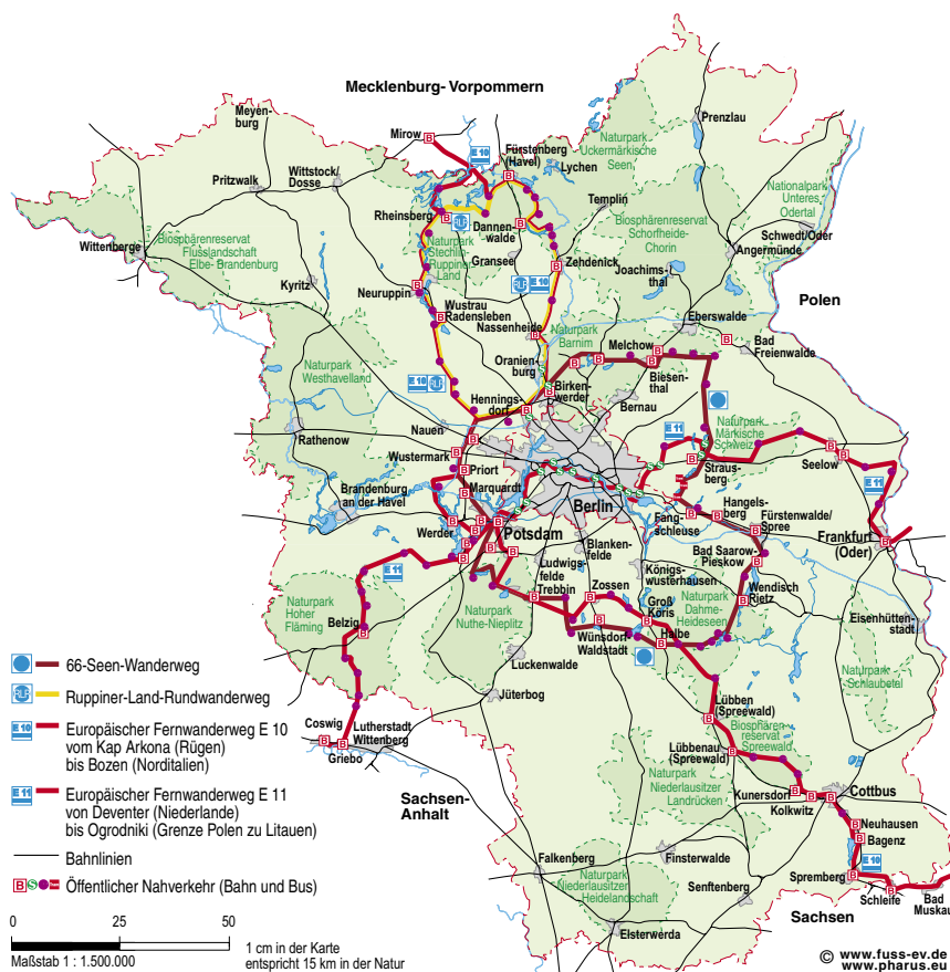
Das Netz der Hauptwanderwege. Karte: Pharus-Plan.

Mit Unterstützung des Ministeriums für Infrastruktur und Raumordnung des Landes Brandenburg (MIR) wird Anfang 2009 die Kampagne abgefahren. losgewandert. gestartet. Plakate und Flyer werden verteilt, Verkehrsunternehmen und die Touristikverbände unterstützen das Vorhaben, der Internetauftritt wird deutlich benutzerfreundlicher und durch weitere Rubriken z.B. wanderWünsche ergänzt