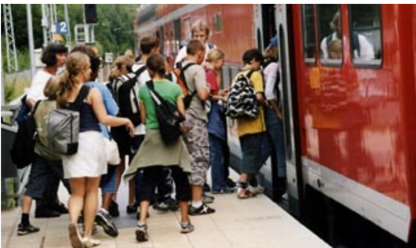
Einsteigende Wanderinnen und Wanderer am Bahnhof Dannenwalde

...kann einen Beitrag zur Steigerung der Fahrgastzahlen im Schienenpersonennahverkehr leisten , das Bewusstsein für den öffentlichen Nahverkehr und die Nutzung von Bahn und Bus auch im Alltag steigern und damit helfen, kleine Bahnlinien und Bahnhöfe zu erhalten.