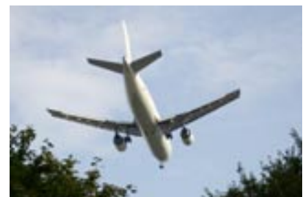
Fl.uglärm beeinträchtigt die „Wander-Ruhe“ an einigen Stellen des Wanderwegenetzes.