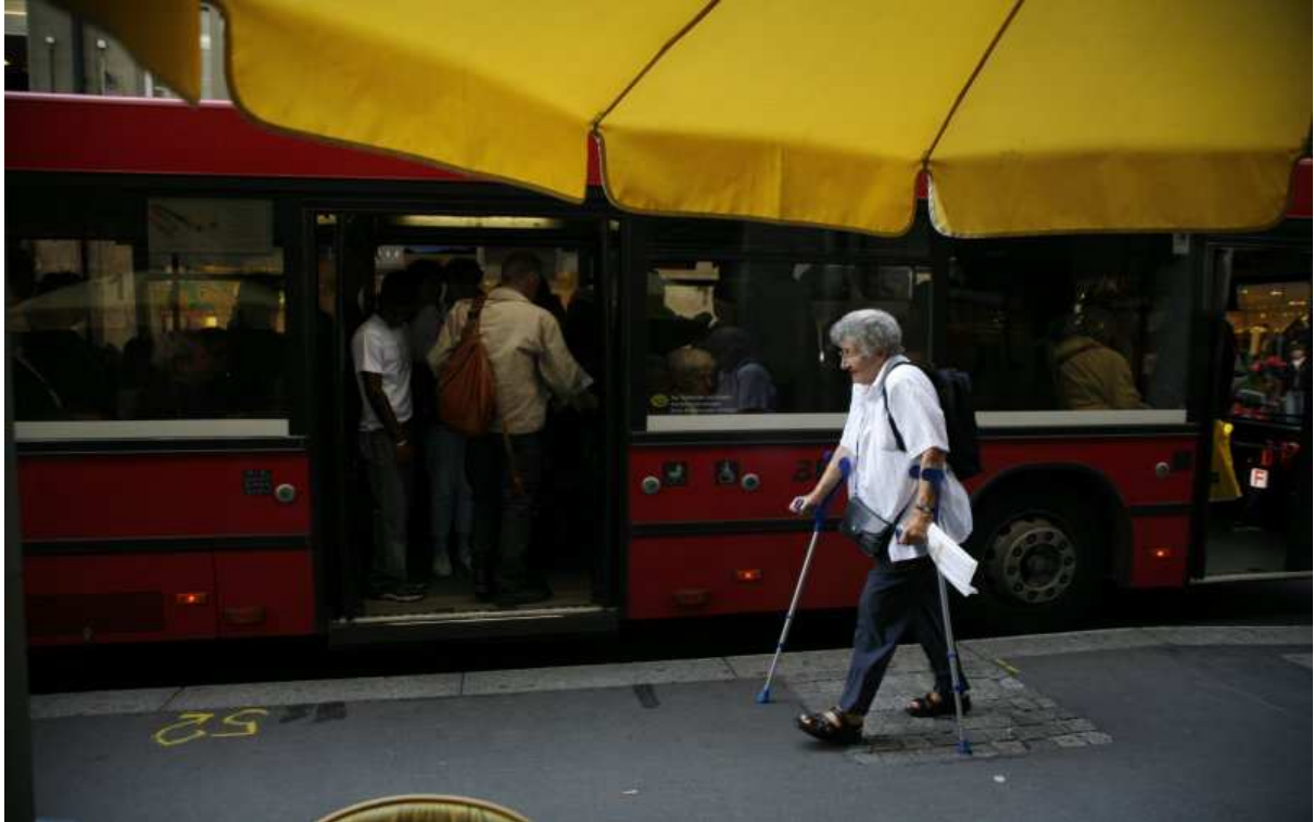
Séance d'information de l'OFT « Bouger jusqu'à 100 ans », 8 avril 2010 : Bases légales