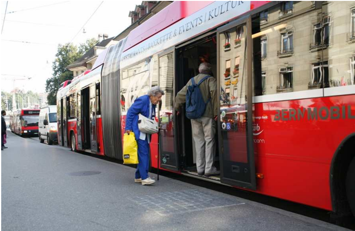
Séance d'information de l'OFT « Bouger jusqu'à 100 ans », 8 avril 2010 : Bases légales