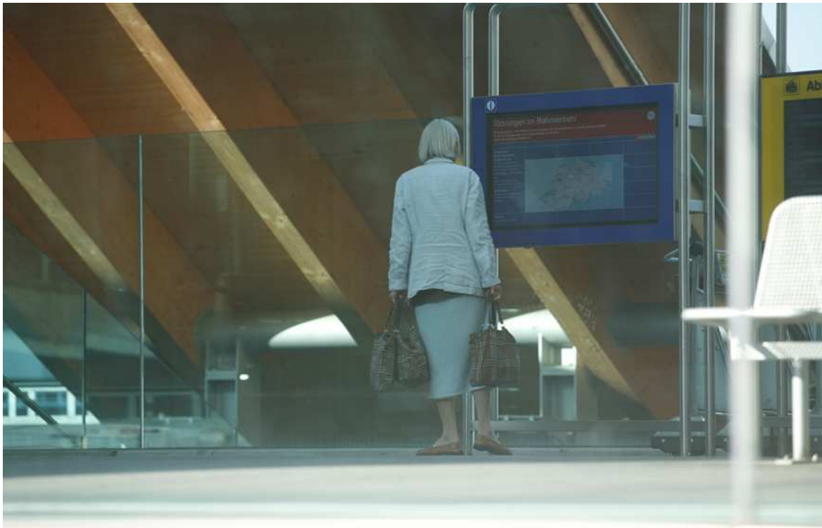
Séance d'information de l'OFT « Bouger jusqu'à 100 ans », 8 avril 2010 : Bases légales