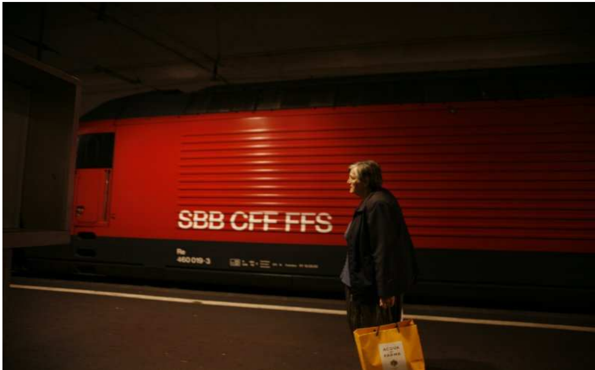
Séance d'information de l'OFT « Bouger jusqu'à 100 ans », 8 avril 2010 : Bases légales