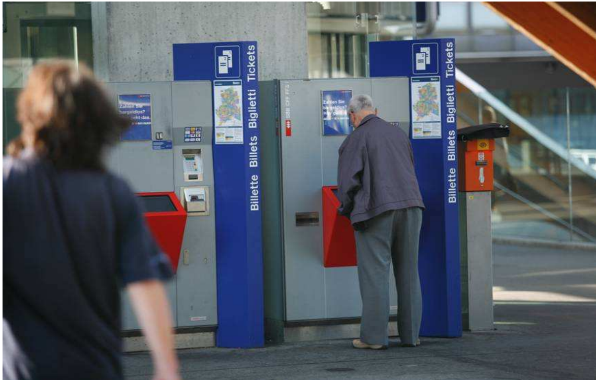
Séance d'information de l'OFT « Bouger jusqu'à 100 ans », 8 avril 2010 : Bases légales