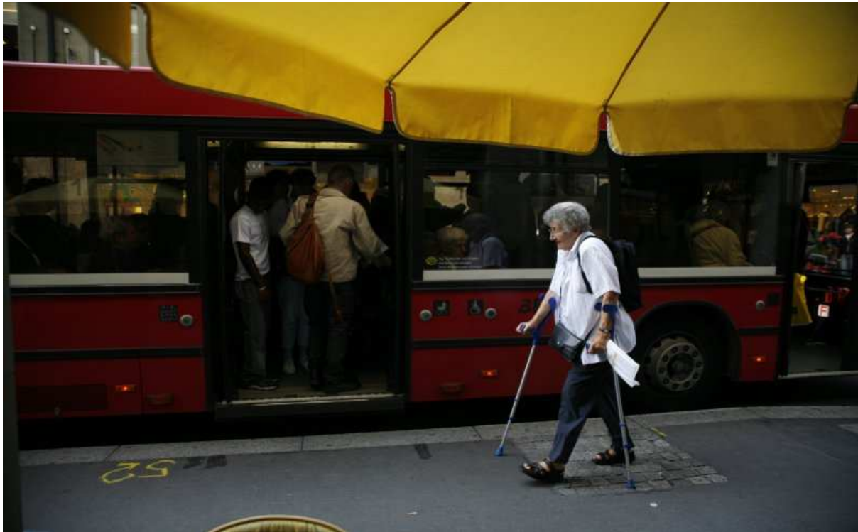
Séance d'information de l'OFT « Bouger jusqu'à 100 ans », 8 avril 2010 : Bases légales