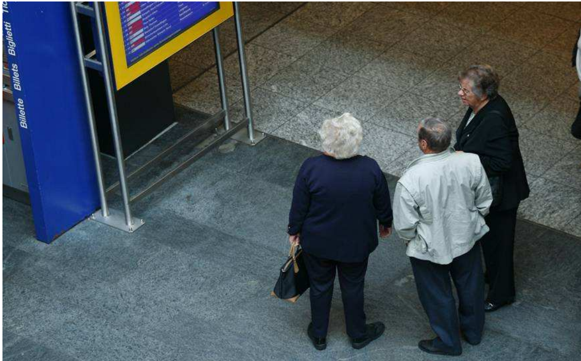
Séance d'information de l'OFT « Bouger jusqu'à 100 ans », 8 avril 2010 : Bases légales