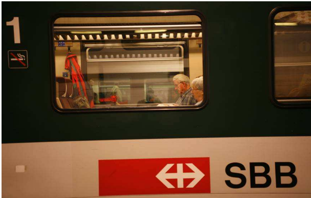
Séance d'information de l'OFT « Bouger jusqu'à 100 ans », 8 avril 2010 : Bases légales