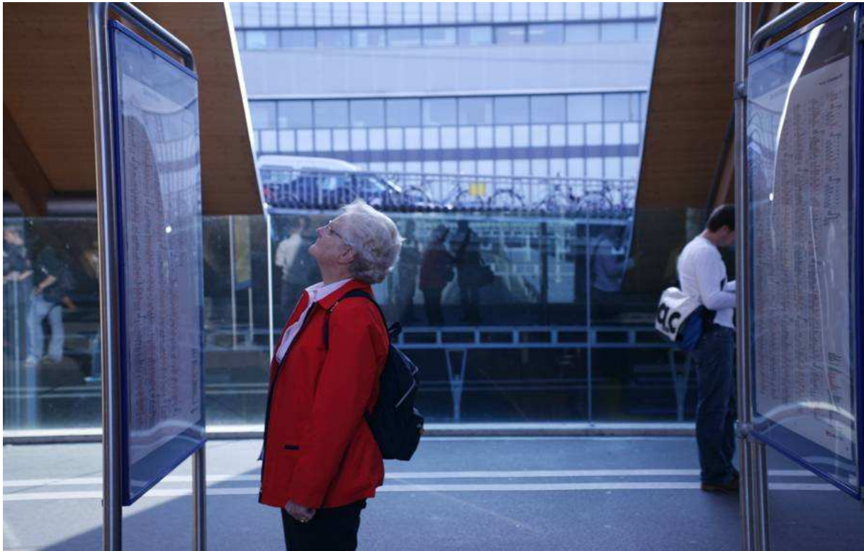
Séance d'information de l'OFT « Bouger jusqu'à 100 ans », 8 avril 2010 : Bases légales