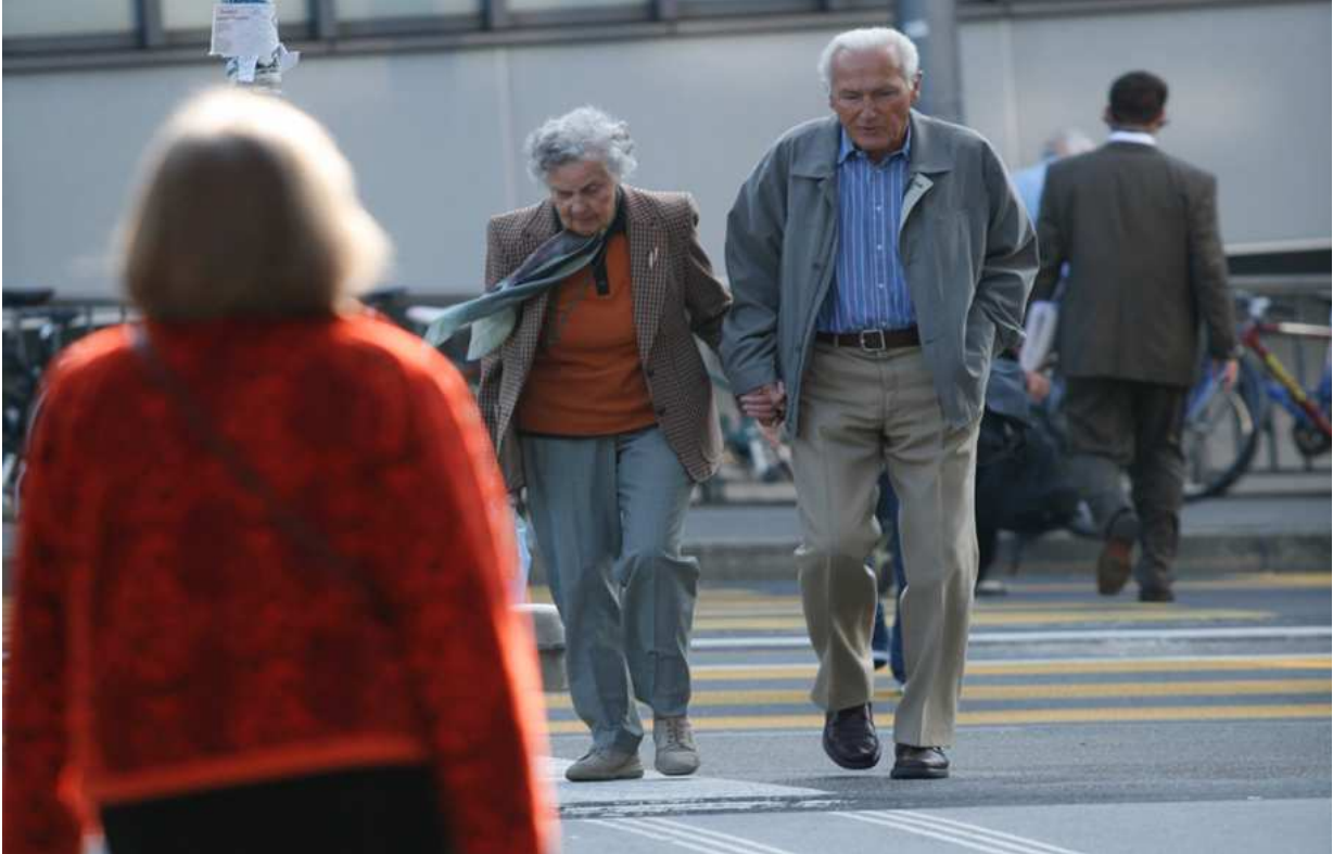
Séance d'information de l'OFT « Bouger jusqu'à 100 ans », 8 avril 2010 : Bases légales