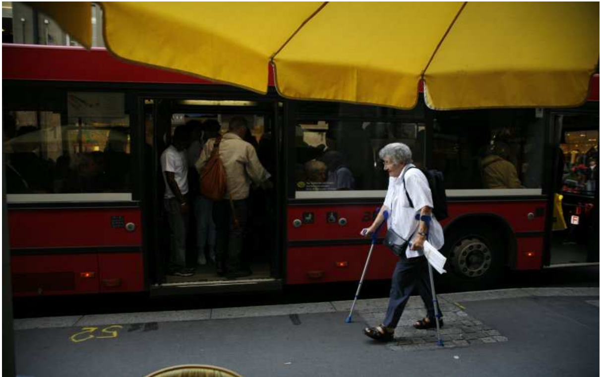
Séance d'information de l'OFT « Bouger jusqu'à 100 ans », 8 avril 2010 : Bases légales