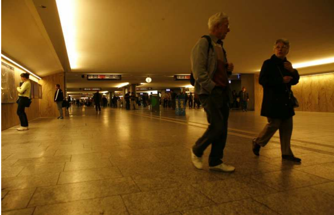
Séance d'information de l'OFT « Bouger jusqu'à 100 ans », 8 avril 2010 : Bases légales