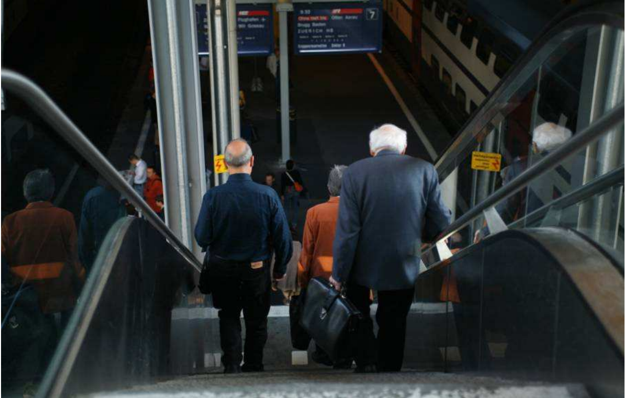
Séance d'information de l'OFT « Bouger jusqu'à 100 ans », 8 avril 2010 : Bases légales