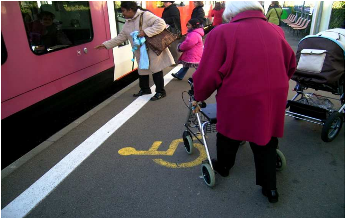
Séance d'information de l'OFT « Bouger jusqu'à 100 ans », 8 avril 2010 : Bases légales