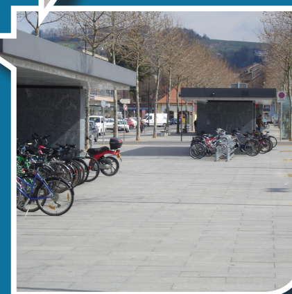
Fachtagung, 10. November 2010 / Journée technique, mercredi 10 novembre 2010