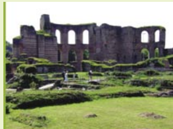
Kaiserthermen - Thermenruine am Rande des Palastgartens