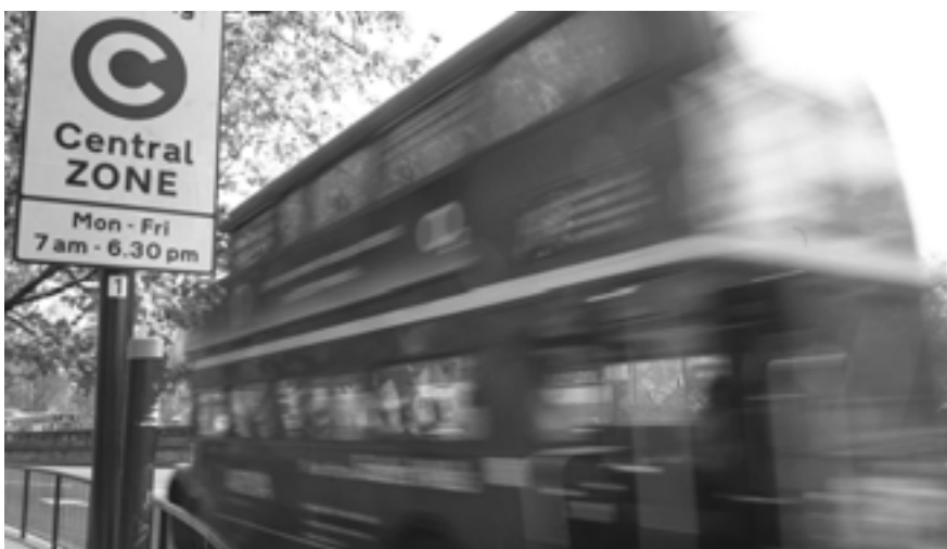
Congestion-Zone in London

In jüngster Zeit ist die Akzeptanz wieder massiv gesunken. Gründe sind, dass das System differenzierter und damit kompli-