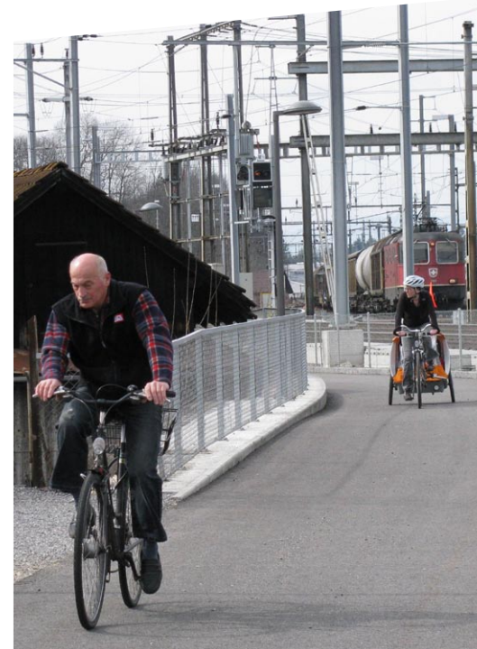
Anerkennungspreis 2010 Velohochstrasse der Stadt Burgdorf

Jurierung, Preisverleihung Frühling 2012