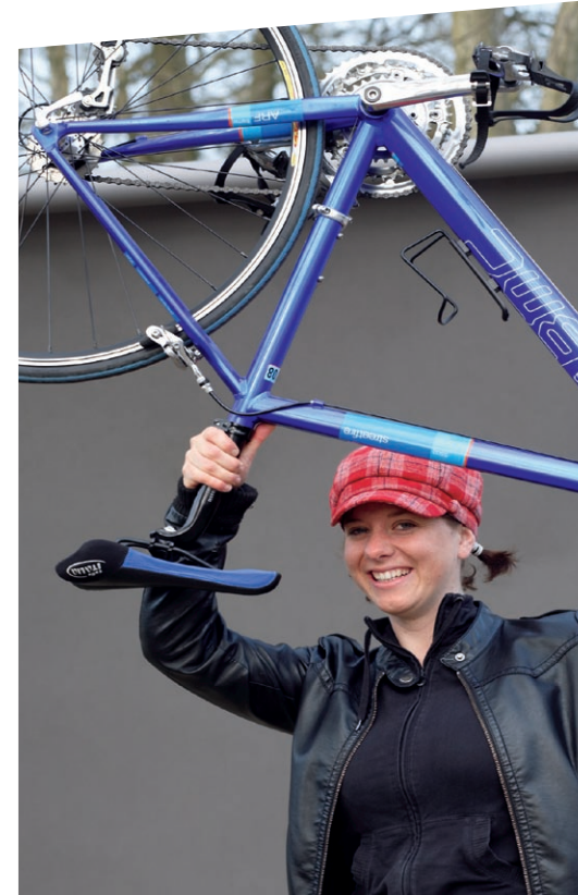
Hauptpreis 2010 Langsamverkehrs-Offensive Solothurn und Region! (LOS!)

Pro Velo Schweiz «Prix Velo Infrastruktur» Postfach 6711 3001 Bern www.prixvelo.ch info@prixvelo.ch