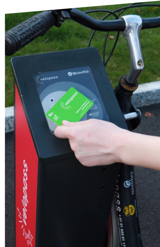
Anerkennungspreis 2010 velopass, Bikesharing-Angebote in der Romandie

Partner des «Prix Velo Infrastruktur» sind das Bundesamt für Strassen (ASTRA), velosuisse und velopa. Medienpartner ist «Schweizer Gemeinde».