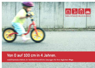
Von 0 auf 100 cm in 4 Jahren. mobilitaetsdurchblick.ch: Spezialisierte Lösungen für Ihre tägliche Wege

Mit dem „ Mobilitätsdurchblick Schweiz “ wurde eine verkehrsmittelübergreifende, webbasierte und weitgehend automatisierte Plattform für die Mobilitätsberatung entwickelt. Das Beratungsinstrument erlaubt Gemeinden, Mobilitätsanbietern oder anderen Institutionen, Privatpersonen respektive Haushalten ohne grossen Aufwand massgeschneiderte Hinweise zur Optimierung des persönlichen Mobilitätsverhaltens zu geben. Der Mobilitätsdurchblick macht präzise Aussagen zur Zeit, die man im Verkehr unterwegs ist, und zu den Verkehrsvollkosten der Haushalte. Ausserdem wird das Verhalten hinsichtlich Sicherheit, Umwelt- und Gesundheitswirkungen sowie Bequemlichkeit bewertet.