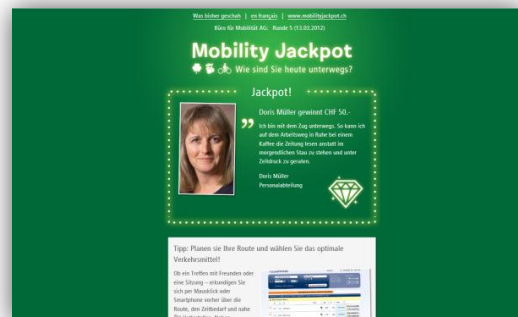
L'outil en ligne, Images: Büro für Mobilität AG