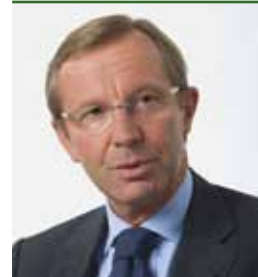
LH-Stv. Dr. Wilfried HASLAUER

Im Land Salzburg hat der Radverkehr bislang vor allem touristische Bedeutung. Es gibt zahlreiche Themenradwege und ein Landesradwegenetz, das stetig ausgebaut wird. Im Landesmobilitätskonzept 2006–2015 ist bis 2015 der Ausbau und Lückenschluss des Landesradverkehrsnetzes sowie begleitende Bewusstseinsbildung geplant.