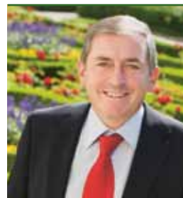
Bürgermeister Dr. Heinz SCHADEN

Auch an radelnden Vorbildern fehlt es nicht: der Bürgermeister der Stadt ist oft mit dem Fahrrad unterwegs. Auf der Homepage www.stadt-salzburg.at findet man umfangreiche Informationen zum Radfahren. Zusätzlich sorgt die eigene Rad-Homepage für Radinformation und -animation ( www.radinfo.at ).