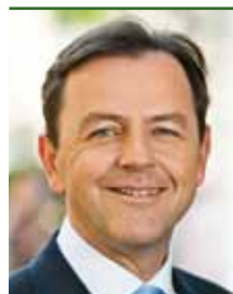
Umweltminister Niki BERLAKOVICH

„Radfahren schützt das Klima, ist gesund und macht Spaß - das gilt es zu vermitteln. Die Bewusstseinsbildung und damit Förderung des Radfahrens als umweltfreundliches und gesundheitsförderndes Verkehrsmittel hat für das Lebensministerium einen hohen Stellenwert.“