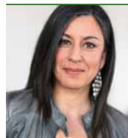
Vizebgm. Maga a Maria VASSILAKOU

Seit November 2011 gibt es in Wien die Radagentur und einen Radverkehrsbeauftragten. Ziel ist es, verstärkt auch Bewusstseinsbildung und Marketing für Radverkehr zu machen, um den Radverkehrsanteil in Wien zu erhöhen. Die Radagentur ist eine Schnittstelle für alle Abteilungen der Stadtverwaltung, Fahrradlobbies und für Menschen in Wien, die sich mit den Rad bewegen.