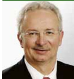
Bürgermeister Ing. Harald SEIDL

Die Agenden des Radverkehrsbeauftragten beinhalten nun ein Mitspracherecht in Angelegenheiten der Radverkehrsplanung, der Bauausführung und der Wartung von Radverkehrsanlagen. Ein Aktions-Schwerpunkt des Radverkehrskordinators im Jahr 2012 wird z. B. die Behebung der Mängel im Radwegenetz und die Festlegung von Fahrradhaupttrouten zur Förderung des Alltagsradverkehrs sein.