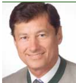
Landesrat Dr. Gerhard KURZMANN

Radfahren hatte in der Steiermark vor allem touristische Bedeutung. Die aktuelle Radverkehrsstrategie 2008–2012 enthält aber neben Maßnahmen zum Radwegeausbau auch solche zur Bewusstseinsbildung zum Thema Radfahren im Alltag. Mit dem Landes-Radverkehrsprogramm 2008–2012 legt das Land Steiermark eine 56 Maßnahmen umfassende Landesradverkehrsstrategie vor. Ziel des Landes ist es, den Radverkehrsanteil auf 12 % zu erhöhen.