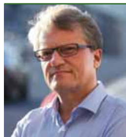
Verkehrsreferent Vizebürgermeister Klaus LUGER

Den RadfahrerInnen in Linz gehört bereits jetzt mit mehr als 140 Kilometern rund ein Viertel des städtischen Straßen- und Wegenetzes. Seit 2005 wurden sieben Kilometer an Radweglücken geschlossen, aktuelle Planungen laufen für weitere sieben Kilometer. In den kommenden Jahren wird also der Ausbau der Radwege weiterhin zu den Schwerpunkten der Linzer Verkehrspolitik zählen.