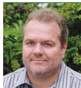
Bürgermeister Ing. Richard HERMANN

Mit der Errichtung einer Solarfahrradtankstelle wurde auf die zunehmende Verwendung von Elektrofahrzeugen reagiert. Während des Aufladens können der Ortskern bzw. Gastronomiebetriebe leicht aufgesucht werden. Die Solarfahrradtankstelle wird in einem offenen System betrieben und steht allen unentgeltlich zur Verfügung.