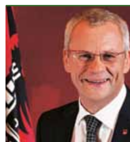
Bürgermeister Mag. Thomas STEINER

Seit dem Jahr 2010 ist Eisenstadt auch eine von fünf E-Mobilitäts-Modellregionen in Österreich. Ziel des Projekts „Eisenstadt e-mobilisiert“ ist es, ein innovatives und umweltfreundliches Mobilitätssystem für die burgenländische Landeshauptstadt auf Basis von elektrisch betriebenen Fahrzeugen zu entwickeln und umzusetzen. Eine zentrale Maßnahme des Projekts „Eisenstadt e-mobilisiert“ wird die nachhaltige Implementierung eines vollautomatischen E-Bike-Verleihsystems sein. Dieses soll vor allem der Integration von E-Mobilität in die täglichen Wegeketten von Aus- und EinpendlerInnen dienen.