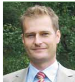
DI Martin EDER, Radverkehrskordinator im Lebensministerium, empfielt

Eine Analyse erfolgreicher Kommunen, Betriebe, Schulen und Tourismuseinrichtungen zeigt eine Gemeinsamkeit: Personen, die beauftragt sind, sich um die Radverkehrsförderung zu kümmern. Radverkehrsbeauftragte koordinieren das Zusammenspiel der AkteurInnen, motivieren die EntscheidungsträgerInnen, fungieren als Ansprechperson für die RadfahrerInnen und setzen Projekte und Maßnahmen um. Durch Radverkehrsbeauftragte werden die Bedürfnisse des Radverkehrs nicht vergessen.