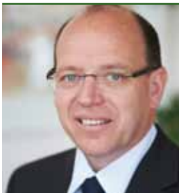
Landesrat Andreas LIEGENFELD

Die Abteilung Tourismus arbeitet gemeinsam mit Gemeinden und den Abteilungen Güterwegebau und Straßenbau am Ausbau des Radwegenetzes. Ein wesentliches Ziel der „Radverkehrsoffensive“ des Landes Burgenland 2008 ist eine Qualitätssteigerung. Sowohl im Freizeitverkehr als auch für AlltagsradlerInnen soll der Radverkehrsanteil deutlich angehoben werden. Das Land Burgenland legte 2008 mit dem „Masterplan Radfahren“ für das Burgenland eine Landesradverkehrsstrategie vor, mit dem Ziel, den Alltagsradverkehr auf insgesamt 10 % zu erhöhen und den Anteil der Rad fahrenden Gäste um 20 % zu steigern.