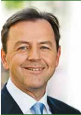
Niki Berlakovich, Umweltminister