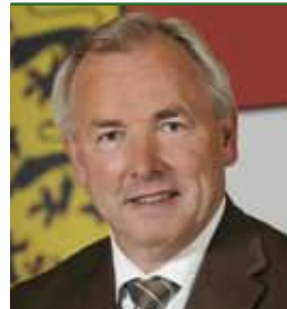
Landeshauptmann Gerhard DÖRFLER

Der Radverkehr in Kärnten ist zum Großteil touristisch geprägt. Das überregionale Radwegenetz ist derzeit gesetzlich verankert. Ein einheitliches Wegweisungssystem wurde umgesetzt. Seitens des Landes Kärnten wurde bislang noch keine explizite Radverkehrsstrategie ausgearbeitet. Die Hauptinitiative des Landes besteht im Ausbau des touristischen Radwegenetzes.