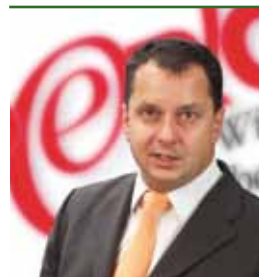
Bürgermeister Anton FROSCHAUER

Als Ergebnis der Errichtung der Mehrzweckstreifen hat sich gezeigt, dass sich durch die optische Eingrenzung der Mittelfahrbahn das Geschwindigkeitsniveau der Kraftfahrzeuge deutlich verringert. Der gesamte Verkehrsablauf ist insgesamt gleichmäßiger und konfliktärmer geworden, dadurch wurde eine Erhöhung der Verkehrssicherheit erreicht.