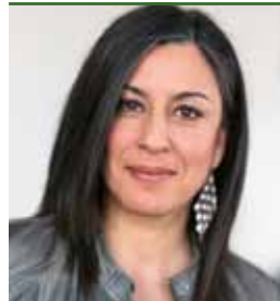
Vizebgm. Magª Maria VASSILAKOU

Im Masterplan Verkehr 2003 (Fortschreibung 2008) hat die Stadt Wien Ziele und Maßnahmen für den Radverkehr definiert. Im Regierungsübereinkommen 2010 wurde eine Erhöhung des Radverkehrsanteils auf 10 % bis zum Jahr 2015 als Ziel gesetzt. In Wien werden Radverkehrsdaten umfassend erhoben. Mit der neuen Radagentur Wien soll die Bewusstseinsbildung für das Radfahren verstärkt werden.