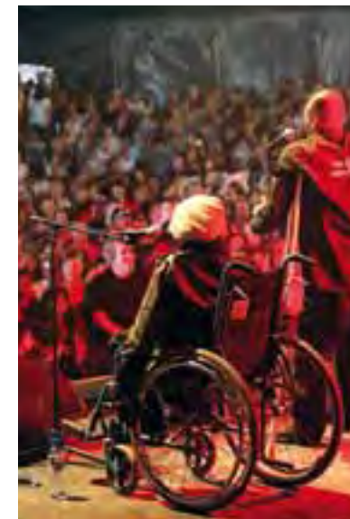
Système de gobelets recyclables et consignés, et scènes accessibles aux chaises roulantes.