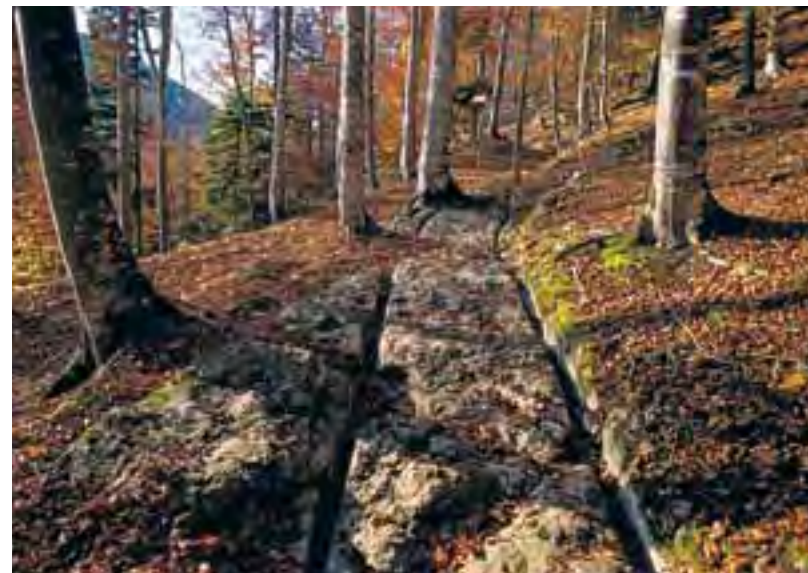
Voies à ornières historiques près de Sainte-Croix.

La ViaFrancigena, tout comme les autres itinéraires culturels en Suisse, est un projet touristique mis en œuvre par ViaStoria, spin-off de l'Université de Berne. Chargée par la Confédération d'établir l'Inventaire fédéral des voies de communication historiques en Suisse (IVS) entre 1984 et 2003, ViaStoria a développé sur cette base un réseau d'itinéraires culturels nationaux (Via) et régionaux (ViaRegio).