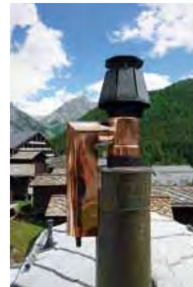
Pont sur l'Allmagellbach et prise d'eau du bisse Moosgufer. Filtre à poussières fines à Saas Fee.

La qualité de l'air, notamment durant la saison d'hiver, a pu être très sensiblement améliorée. Saas-Fee a en effet déclaré la guerre aux particules fines : 70% des chauffages au bois dans les constructions privées et publiques (quelque 300 cheminées) ont été équipés de filtres à particules fines grâce au soutien financier de la commune et des entreprises. La destination touristique est ainsi en passe de devenir la première du monde sans poussières fines. Par cette action, elle stimule également l'économie locale, un tiers de l'investissement d'environ un million de francs allant à des entreprises locales.