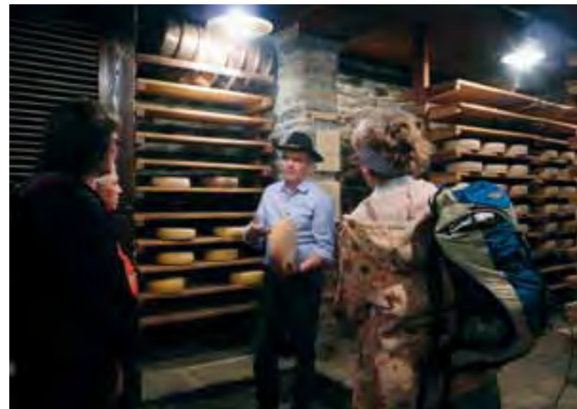
Les visites comme celle de cette salle d'affinage des fromages font aussi partie du programme.

Développer des offres touristiques durables et compétitives est un but important des parcs suisses. Avec l'aide financière d'Innotour, le Réseau des parcs suisses a lancé une offensive qualité pour faciliter le développement d'offres individuelles et interrégionales. Au cœur du projet, les coaches aident les directions des parcs, les organisations touristiques et les prestataires de services à cette fin. Le Réseau des parcs suisses assure les