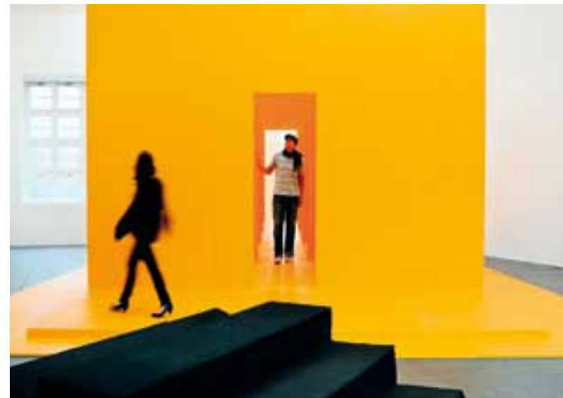
Transports publics à prix réduits et entrée libre dans tous les musées zurichoïses grâce à la ZürichCARD .

ISO 14001, etc. et propose le concept Green Meeting , élaboré avec le WWF et fondé sur trois principes : réduire, compenser, communiquer.