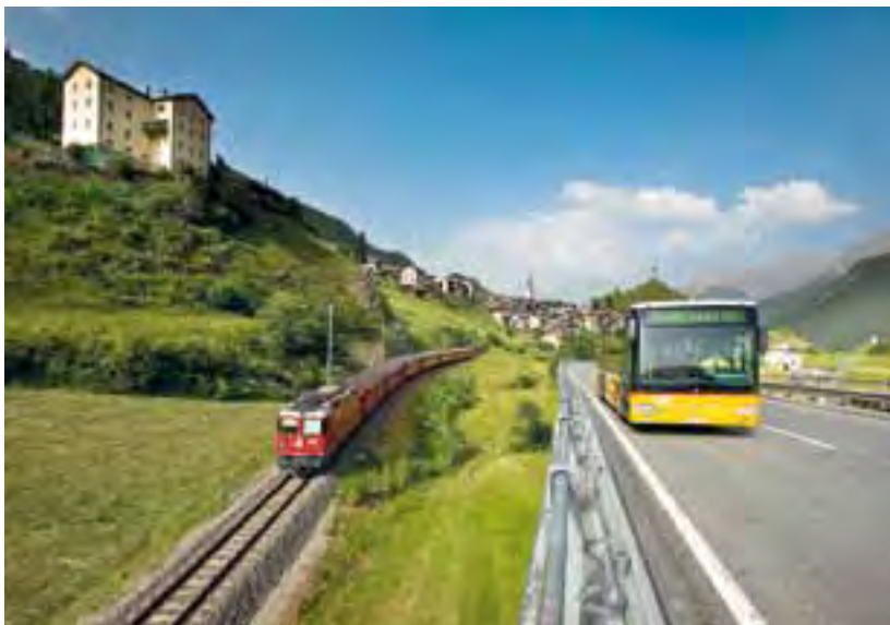
Les transports publics jouent un rôle important en Basse-Engadine.

offres (bains thermaux à vocation ludique et thérapeutique, vastes réseaux pédestres, cyclistes ou de ski de fond. Des offres spécifiques s'adressent aux enfants ou aux seniors). En tant qu'employeurs, les responsables de la destination misent sur la formation continue de leurs collaborateurs, en les habilitant à être des ambassadeurs d'un tourisme de qualité et durable.