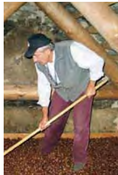
Gràa, grenier de séchage des châtaignes et épicerie proposant des produits de la vallée.

L'association Pro Brontallo emploie quatre personnes. Elle est responsable des projets, du marketing et de la communication et remplit les rôles de prestataire touristique et de coordinatrice. Pour gérer les contributions publiques (Confédération, canton), la fondation Monti e Paesaggio a été créée.