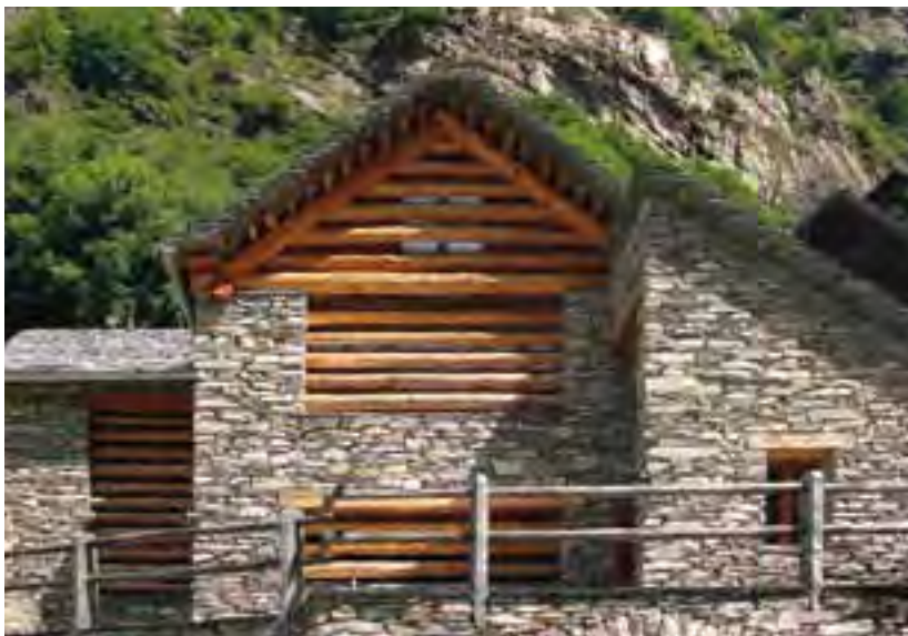
Rénovation de bâtiments traditionnels destinés à l'agritourisme à Brontallo.