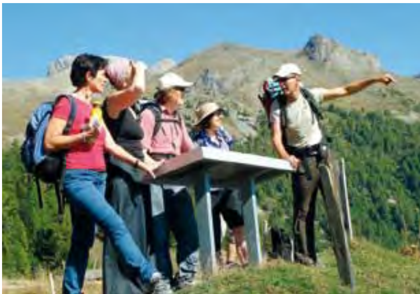
Lier l'apprentissage des langues à la découverte des parcs naturels avec le projet Lingua Natura.

types de paysage, la géologie, la faune et la flore lors d'excursions diverses dévolues, par exemple, à l'observation des animaux sauvages ou aux herbes médicinales.