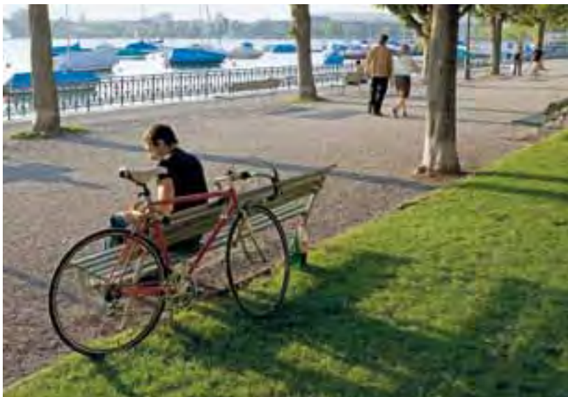
En collaboration avec la ville et la région, Zürich Tourismus mise sur la mobilité douce.

itinérante De l'eau pour tous! d'Helvetas ou la vente de la bouteille d'eau ZH2O en faveur du projet d'entraide PlayPumps en Tanzanie.