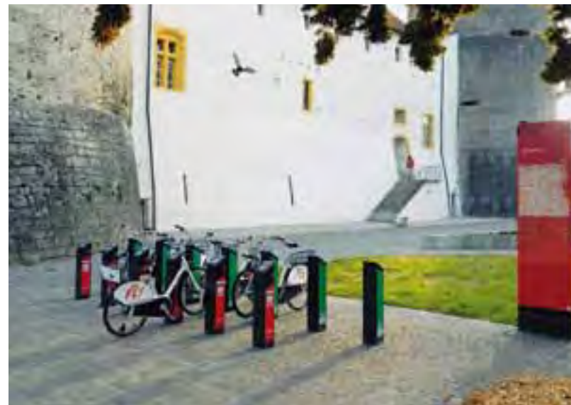
Mit dem Velo des Ausleihsystems die Region Yverdon-les-Bains entdecken.

ist daher leicht mit den öffentlichen Verkehrsmitteln zu erreichen. Dem Langsamverkehr wird ein hoher Stellenwert eingeräumt: Ausflüge zu Fuss, insbesondere auf den drei historischen Verkehrswegen Via Romana, Via Francigena und Via Salina bilden attraktive Angebote. Auch die Nutzung des Fahrrads wird gefördert, z.B. mit dem Veloverleih in Yverdon-les-Bains, dem Velopass, den E-Bike-Vermietungen in Ste-Croix, Yvonand und Orbe, dem Gratistransport der Velos auf der Zugstrecke Yverdon-les-Bains bis Ste-Croix und auf den Schiffen der Schifffahrtsgesellschaft des Neuenburger- und Murtensees. Ausserdem können Exkursionen auf Schiffen mit Elektrosolarantrieb unternommen werden. Alle Mitarbeiterinnen und Mitarbeiter erhalten kostenlos ein Halbtax-Abonnement. Neben dem Tourismusbüro in Yverdon-les-Bains befindet sich ein Mobility-Carsharing-Stellplatz. In Zusammenarbeit mit der Hochschule für Technik und Wirtschaft Waadt (HEIG-VD) werden Pionierprojekte wie Planet Solar, die erste Weltumrundung mit einem Solarboot, oder Icare, eine Weltumrundung in einem mit Wind- und Sonnenenergie betriebenen Fahrzeug, gefördert.