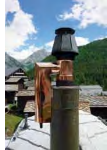
Brücke über den Almagellerbach und Wasserfassung der Suone Moosgufer. Feinstaubfilter in Saas Fee.

Unter den Projekten zur Förderung der erneuerbaren Energien gehört die Trinkwasser-Turbinierung zur Stromerzeugung zu den herausragenden Beispielen. Zudem hat Saas-Fee den Feinstaubfiltern den Kampf angesagt: In 70 Prozent der privaten und öffentlichen Holzheizungen wurden dank der finanziellen Unterstützung von Gemeinde und Unternehmen Feinstaubfilter installiert. Der Einbau der Filter führt vor allem im Winterhalbjahr zu einer deutlichen Verbesserung der Luftqualität. Damit ist der Ort auf dem besten Weg, eine feinstaubfreie Tourismusdestination zu werden. Mit dieser Aktion erhält auch die heimische Wirtschaft wichtige Impulse, geht doch ein Drittel der Investitionen für die Feinstaubfilter von rund einer Million Franken in Form von Aufträgen an lokale Unternehmen.