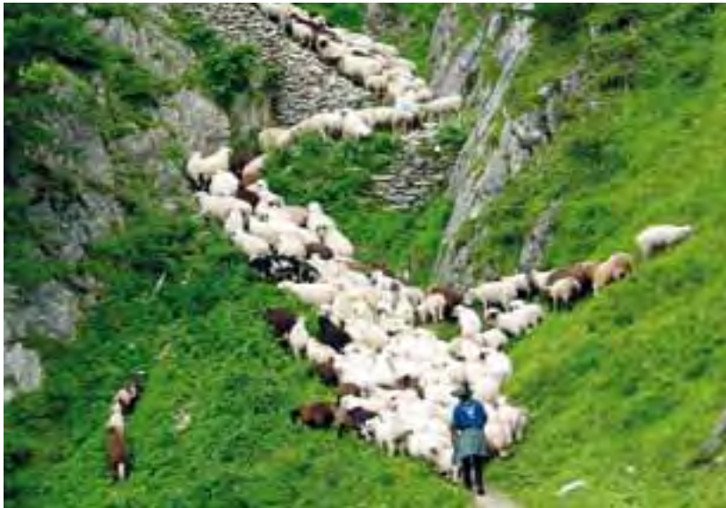
Die Pflege der traditionellen Schäferei ist Teil der nachhaltigen Regionalentwicklung.

Klimawandel sowie die Bewahrung der Welterberegion unter Einbezug einer nachhaltigen Regionalentwicklung.