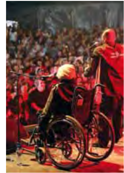
System mit Pfandbechern und rollstuhlgängige Bühnen am Paléo Festival in Nyon.