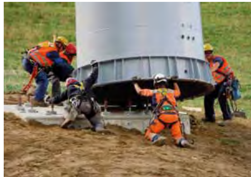
Die Erneuerung der Seilbahn Rougemont – Videmanette erfolgte auf Basis einer Nachhaltigkeitsbeurteilung.

Die Waadtländer Agenda21 will die Nachhaltige Entwicklung in die öffentliche Politik einbinden und die wirtschaftliche Entwicklung fördern. Ausgehend vom Berner Nachhaltigkeitskompass entwickelte die Fachstelle UDD 2006 für alle Interessierten und Gemeinden das Beurteilungsinstrument Boussole21, das später mithilfe der beteiligten kantonalen und regionalen Akteure für Tourismus- und Wirtschaftsprojekte adaptiert wurde. An der fachlichen und methodischen Entwicklung waren UDD und SELT, die regionalen Verantwortlichen der Wirtschaftsentwicklungsverbände sowie die Firma Estia im Wissenschaftspark der ETH Lausanne beteiligt. Mit dem Instrument erfüllt der Kanton die Anforderungen des Bundes an eine Beurteilung von Programmen und Projekten der Neuen Regionalpolitik aus Sicht der Nachhaltigen Entwicklung.