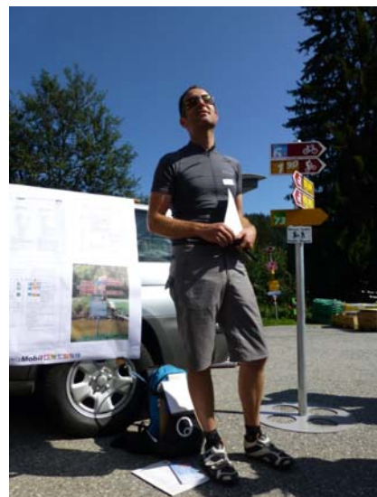
Pumptrack & Skill Area, Laax GR