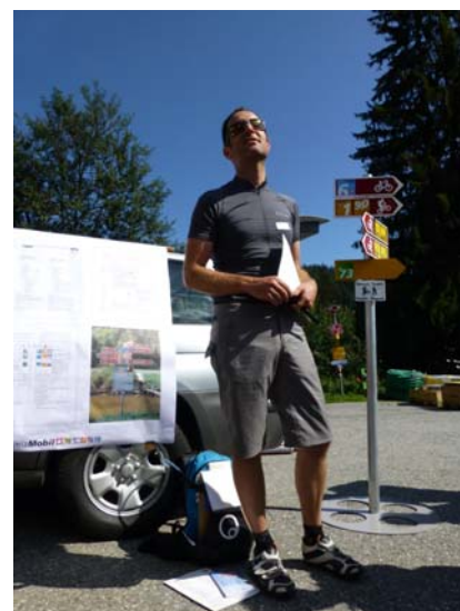
Pumptrack & Skill Area, Laax GR