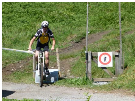
Runcatrail, Flims GR