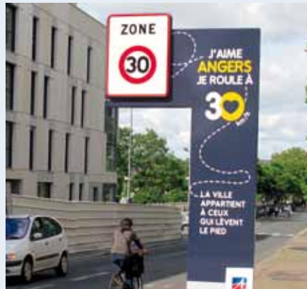
Angers (F). Concertation et communication font partie intégrante du projet de faire passer 90% des rues à 30 d'ici fin 2014. Perspective positive pour les slogans aussi.

On découvrira en particulier les expériences de deux «villes à 30»: l'exemple emblématique de Graz, en Autriche, connue pour avoir décidé il y a 20 ans de mettre 80% de la ville à 30, en une seule étape, en misant sur la communication plutôt que sur les aménagements. Un choix qui participe de la nouvelle culture de la mobilité voulue par cette ville de 270'000 habitants, et dont on pourra faire le bilan sur la durée.