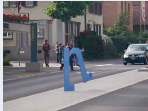
Köniz (BE), exemple bien connu du «modèle bernois». On en connaît moins le concept de communication imaginaire, développé sous de multiples formes – visibles ou non sur le terrain.

Une fois réalisés, les aménagements novateurs attirent les visiteurs, intéressés à s'inspirer d'expériences réussies. C'est le cas des exemples du désormais bien connu «modèle bernois», dont on connaît en revanche moins le volet communication. Construit pas à pas tout au long du processus et jusqu'au suivi après réalisation, il a largement contribué à la réussite de ces projets.