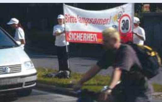
Graz (A). Exemple emblématique que cette «ville à 30» qui mise depuis 20 ans d'abord sur la communication pour faire passer le message. Pour une nouvelle culture de la mobilité.

La journée Rue de l'Avenir permettra de découvrir des exemples de démarches et d'échanger les expériences entre intervenants et participants.