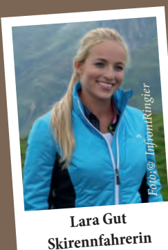
Lara Gut Skirennfahrerin

«Wenn ich auf Tour bin, fahren alle Musiker und Techniker gemeinsam in einem Tourbus zum Konzertort. Mehrere Stunden in den engen Sitzen ist nicht immer angenehm, aber da wir viel Material transportieren, kommt Zugfahren leider nicht in Frage. Privat bin ich meist mit dem ÖV unterwegs.»