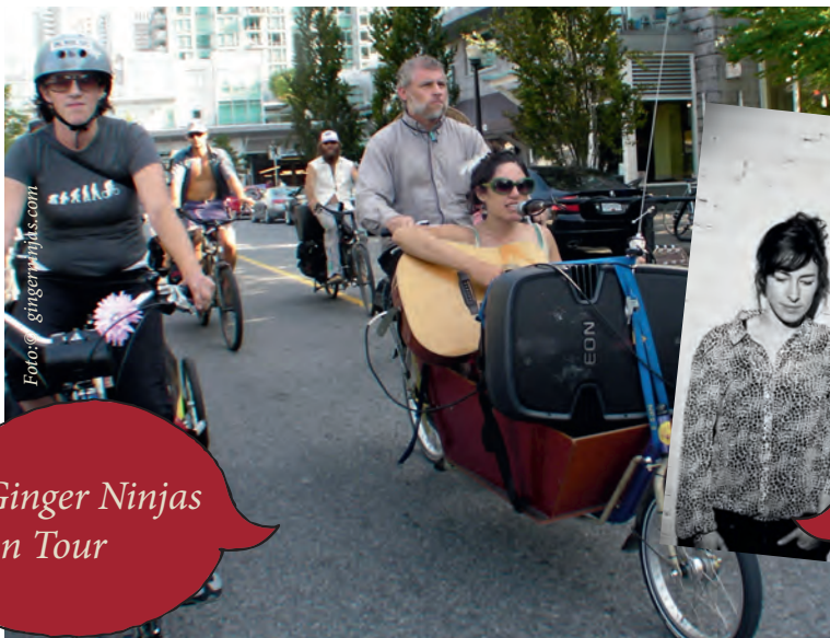
Ginger Ninjas on Tour

Fazit: Wie uns die «Ginger Ninjas» oder «Boy» vermuten lassen: Das beste Verkehrsmittel ist oft nicht dasjenige, an welches man als Erstes denkt!