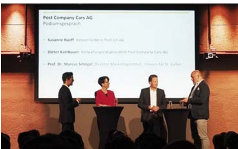
Table ronde sur Post Company Cars