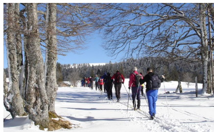
Val-de-Travers – Le Couvent NE: Langlaufen am Creux du Van