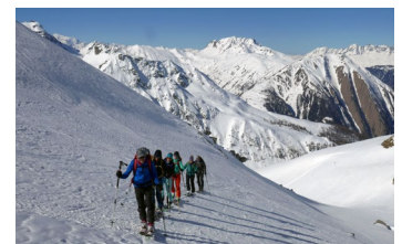
Binntal VS: Aussichtsreiches Touren