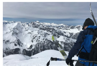
Diemtigtal BE: Auf die Skier – fertig – los!

Der Schneetourenbus im Netz: www.schneetourenbus.ch www.facebook.com/schneetourenbus www.instagram.com/schneetourenbus