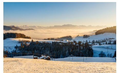
Zürioberland ZH: Aussicht vom Ghöch

Der Schneetourenbus im Netz: www.schneetourenbus.ch www.facebook.com/schneetourenbus www.instagram.com/schneetourenbus