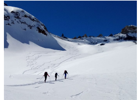
Julierpass – Silvaplana GR: Neue Tourenziele mit ÖV erreichbar