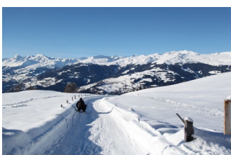
Safiental GR: Schlitteln in Brün