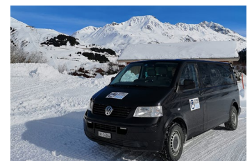
Meiental UR: Schneetourenbus in Aktion