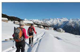
Lukmanier GR: Aussichtsreiches Touren