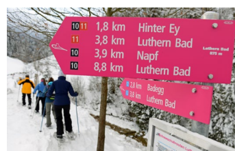
Luthertal LU: Markierte Trails