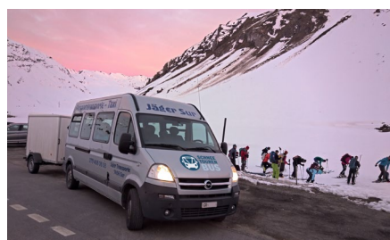
Julierpass GR: Klicken, mitfahren, Umwelt schonen!